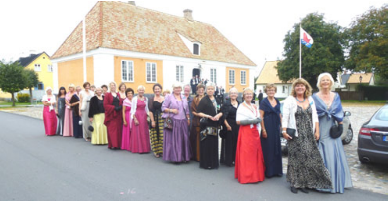
Systrarnas procession från Rådhuset till kyrkan. Är väl inte detta lika elegant som på Nobelfesten ?