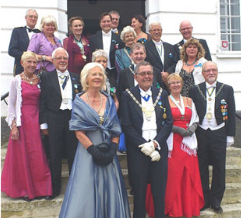
Tillresta Honoratiore med Aldermansparet